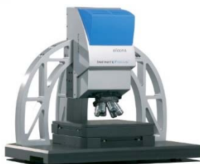
Contrôle Un profilomètre optique 3D