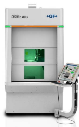
Industrialisation 3D Une machine de texturation 3D (5 axes) industrielle