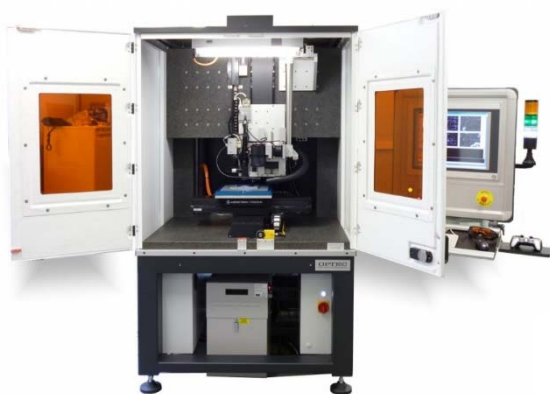
Industrialisation 2D Un centre de micro-usinage laser (fs-ps-ns) multi longueur d'onde

Un parc machine unique dédié à la fonctionnalisation de surface