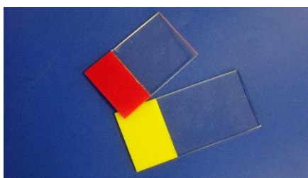
Assemblage en bord à bord de PMMA